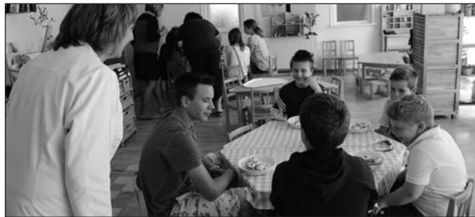
A Palóc Napokra gofrival várták vissza az intézménybe az innen az életbe indult ovisokat.

A nagycsoportos gyermekeink az óvodánk végén többször találkoztak a leendő tanító nénijükkel. A mesemondó verseny, az óvodalátogatás, az iskolalátogatás, a szülői értekezlet már mind-mind az óvoda-iskola átmenet megkönnyítését célozta meg.