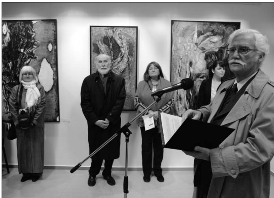
Aktív művész patai kötődéssel

- Nyilvánvaló, hogy egy hozzám hasonló érzékeny, nyitott művészember a festészetten keresztül próbál választ adni a lepel valóságának kérdésére. Sokszor az az érzésem, hogy én tulajdonképpen mindig a leplet festem, legyen a mű, amit épp készítek, tájkép, vagy portré -vallott az alkotó a művekről.